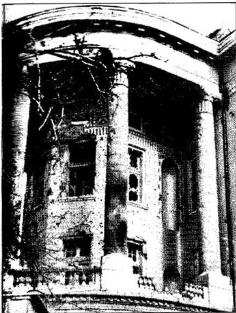
Дворец Амина после штурма его советскими спецназовцами

шину наших врачей тоже не пощадили свои. Ее уничтожили уже упомянутые зенитчики. "Шилка" разнесла машину на куски. Да мы не держим на них зла. На войне, как на войне.