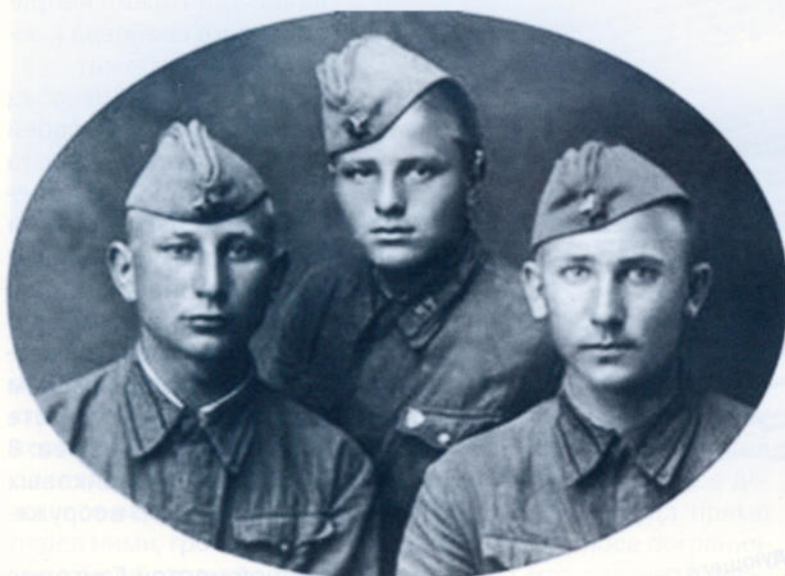
Перед отправкой на фронт. 1941 год