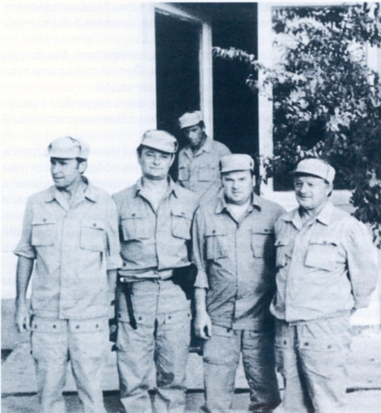
На территории посольства СССР в Кабуле. 1979 год

вещание, телефонную и телеграфную связь, и другие. Все боевые воинские части подлежали захвату и разоружению.