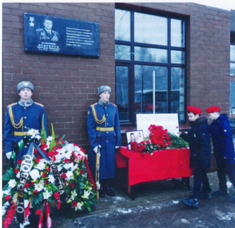
Мемориальная доска, открытая 19 декабря 2017 года на улице Бояринова в городе Балашихе Московской области