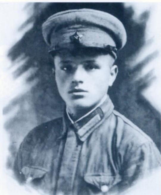
На лагерных сборах. Черкассы, 1940 год